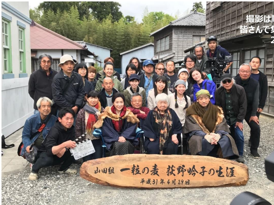
撮影は順調に進んでいます。 皆さんで集合写真を撮りました！ 2019.04.29