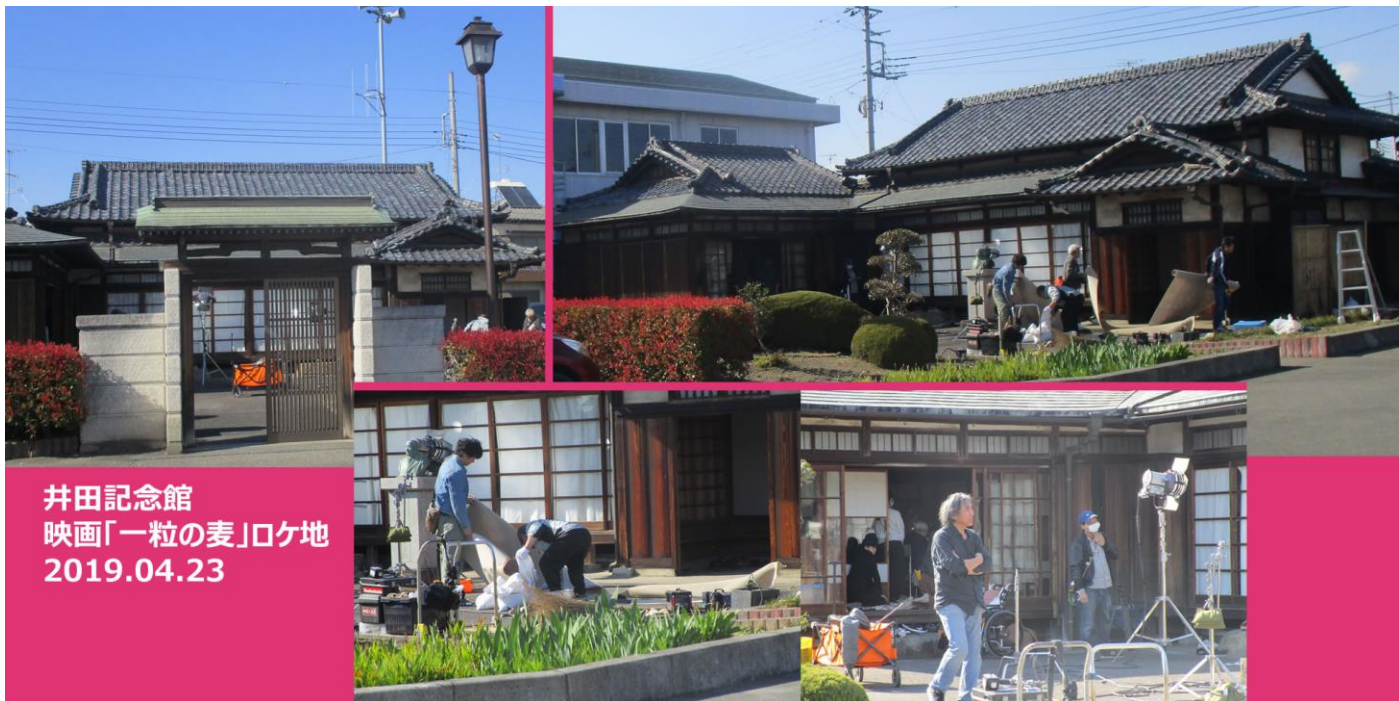
井田記念館 映画「一粒の麦」ロケ地 2019.04.23